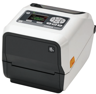
ZD620t-HC mit LCD