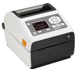
ZD620d-HC mit LCD

Als Gesundheitsdienstleister müssen Sie Ärzten und Pflegepersonal die Tools zur Verfügung stellen, die sie jeden Tag für eine optimale Gesundheitsversorgung benötigen. Der ZD620-HC von Zebra bietet mit seiner überragenden Druckqualität und hochmodernen Features weitaus mehr als herkömmliche Desktopdrucker. Der als Thermodirekt- und Thermotransfer-Modell erhältliche ZD620-HC bietet mehr Standardfunktionen als jeder andere Zebra-Desktopdrucker sowie ein optionales Bedienfeld mit zehn Tasten und LCD-Farbdisplay, das Druckereinstellung und Statusprüfung vereinfacht. Der speziell für den Einsatz im Gesundheitswesen entwickelte ZD620-HC ist desinfektionsmittelbeständig und verfügt über ein für medizinische Zwecke geeignetes Netzteil. Mit der optionalen Druckauflösung von 300 dpi werden selbst winzige Etiketten gestochen scharf und gut lesbar gedruckt. Der ZD620 nutzt Link-OS® und wird von unserer leistungsstarken Print DNA-Suite mit Anwendungen, Dienstprogrammen und Entwicklertools unterstützt, die durch bessere Performance, einfachere Fernverwaltbarkeit und unkomplizierte Integration für ein überzeugendes Druckerlebnis sorgt. Der ZD620 von Zebra bietet die Druckgeschwindigkeit, Druckqualität und Verwaltbarkeit, die Sie brauchen, um die Produktivität, Genauigkeit und Qualität bei der Pflege zu steigern.