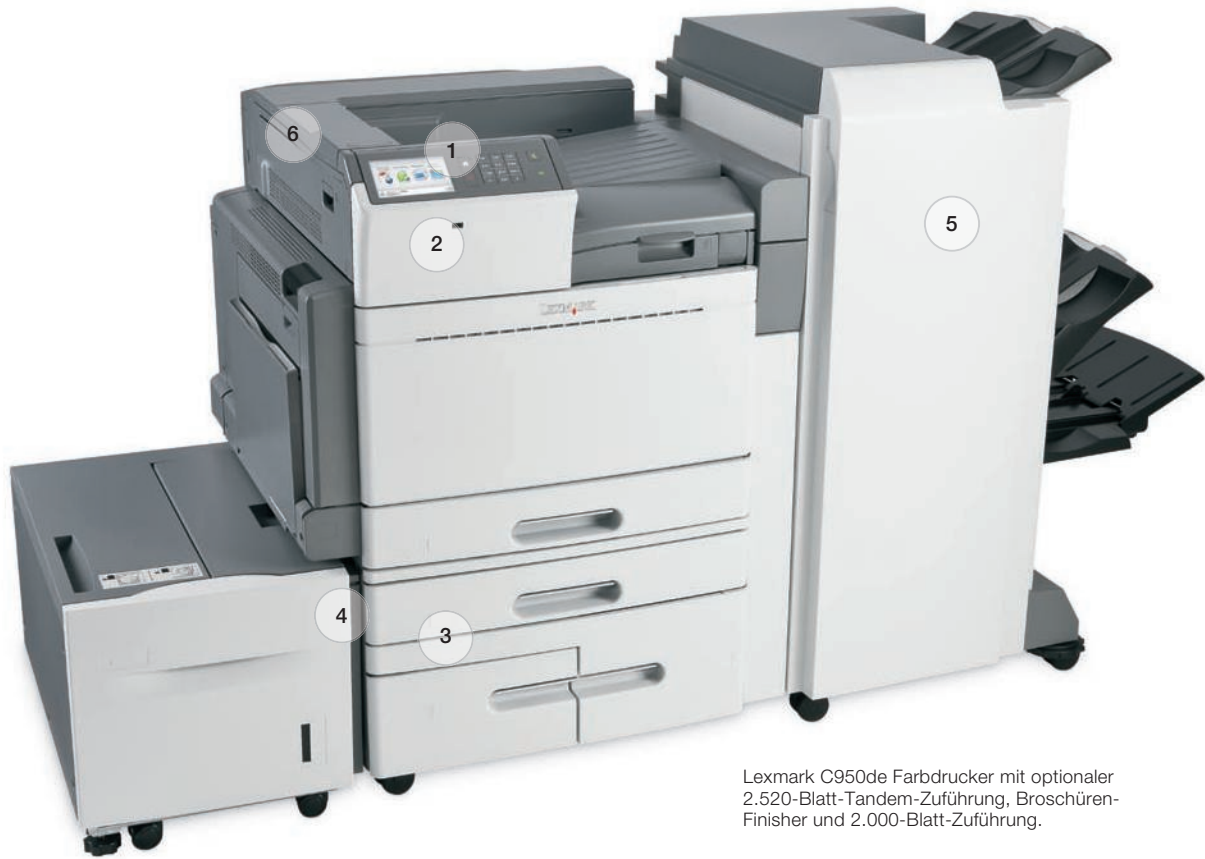
Lexmark C950de Farbdrucker mit optionaler 2.520-Blatt-Tandem-Zuführung, Broschüren-Finisher und 2.000-Blatt-Zuführung.