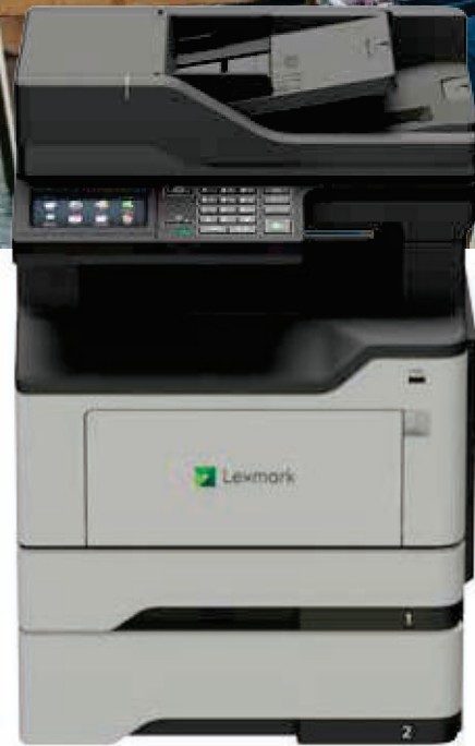
MX421ade mit optionaler Zuführung

Zuverlässigkeit. Sicherheit. Produktivität.