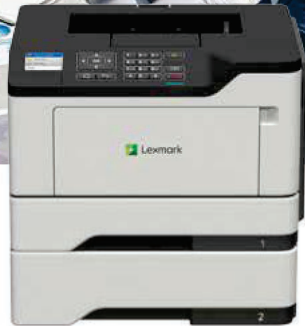
MS521dn mit optionalen Zuführungen

Zuverlässigkeit. Sicherheit. Produktivität.