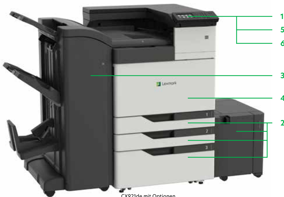
CX921de mit Optionen

Drucken Sie Microsoft Office-Dateien, PDFs und andere Dokument- und Bildarten von Flash-Laufwerken, oder wählen Sie Dokumente auf Netzwerk-Servern oder Online-Laufwerken aus und drucken Sie sie.