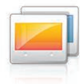
Anpassung des Displays