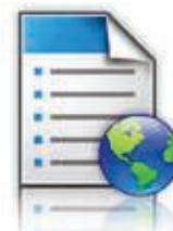
Formulare und Favoriten

Die Lösungen dieser Serie, die Lexmark Tools zur Flottenverwaltung und Ihre bestehende Enterprise-Software und technische Infrastruktur kombinieren, bilden gemeinsam das Lexmark Smart MFP-Ecosystem. Die damit verbundene Anpassbarkeit sorgt dafür, dass Ihre Investition in die Lexmark Technologie eine zukunftssichere Anlage ist.